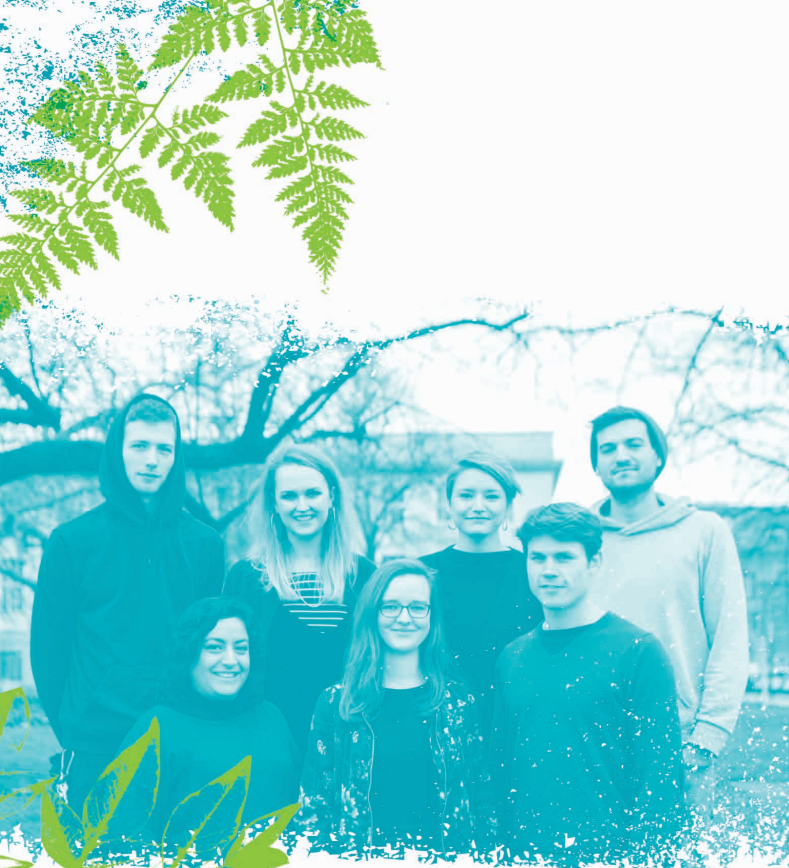
Jugendbeteiligungsbüro der Stiftung Bildung