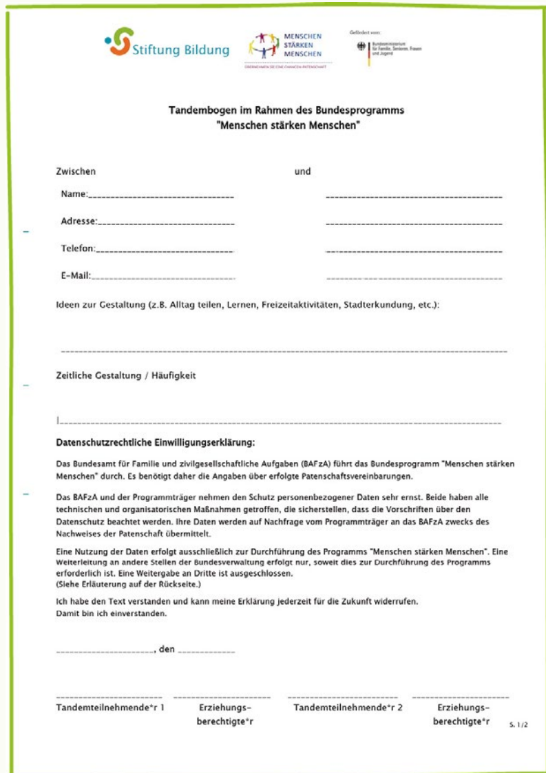
Abbildung eines Tandembogens: